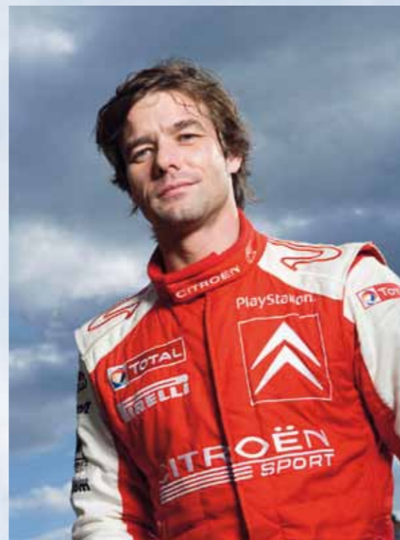
Le pilote français, Sébastien Loeb, a remporté avec son copilote Daniel Elena, le Championnat du Monde des Rallyes 2009.

Hoofdpijnen en belangrijke details begrijpen uit een tekst over sport.